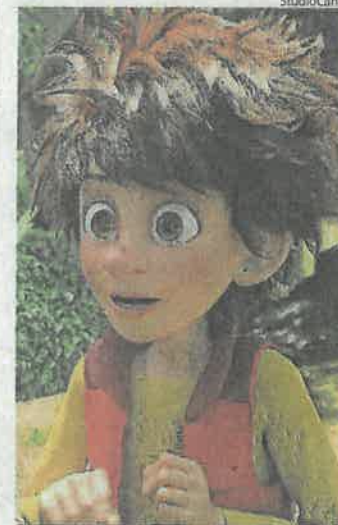
« Bigfoot junior » est en avant-première aujourd'hui.

« Bigfoot junior » à 14 heures en avant-première. ( adulte 5,50 €, moins de 16 ans 4,50 €). « La tour sombre » (AD) à 14 heures (VOST), 19 h 30 et 22 h 15. « Sleepless » interdit aux moins de 12 ans à 14 heures, 19 h 30 et 22 h 15. « Annabelle 2 : la création du mal » (AD) interdit aux moins de 12 ans à 14 heures, 16 h 45, 19 h 30 et 22 h 15. « Ratrapage » (AD) à 11 h 15, 14 heures et 19 h 30. « La planète des singes : suprématie » (AD) à 11 h 15, 16 h 45 et 19 h 30. En 3D 14 heures et 22 h 15. « Cars 3 » (AD) à 11 h 15, 14 heures, 15 h 30 (3D), 16 h 45 et 19 h 30. « #Pire soirée » (AD) à 16 h 45. « Les as de la jungle » (AD) à 11 h 15 et 16 h 45. « Valerian et la cité des mille planètes » à 11 h 15, 14 heures, 19 h 30 et 22 h 15 (VOST). En 3D 16 h 45 et 21 heures. « Chouquette » (AD) à 13 h 45. « I wish-Faites un vœu » Interdit aux moins de 12 ans à 22 h 15. « Spider-Man : homecoming » (AD) à 11 h 15. « Dunkerque » (AD) à 11 h 15, 16 h 45, 19 h 30 (VOST) et 22 h 15. « Baby driver » (AD) à 22 h 15. « Sales gosses » (AD) à 11 h 15. « Moi, moche et méchant 3 » (AD) à 11 h 15, 16 h 45 et 18 h 15.