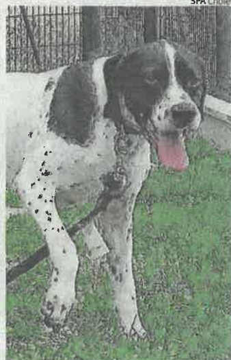
Elan est un chien plutôt timide.

Élan est un pointer de 8 ans, trouvé et non réclamé. C'est un gentil chien qui apprécie la présence de l'équipe. Plutôt timide, il appréciera des maîtres présents, adeptes de balades et possédant un petit espace. Il a une compagne de box Fjara avec laquelle il fait de bonnes parties en parc ! Plus de renseignements au Refuge de Cholet au 02 41 71 99 99 - site : la-spa.fr/cholet